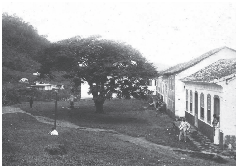
Praça de Viana. Viana/ES. 1907/1908.