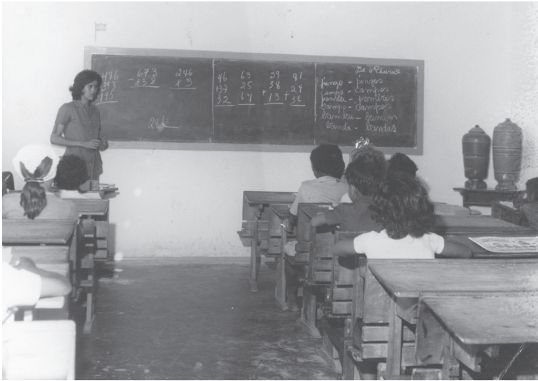
Atividade escolar. Viana/ES. Sem data.