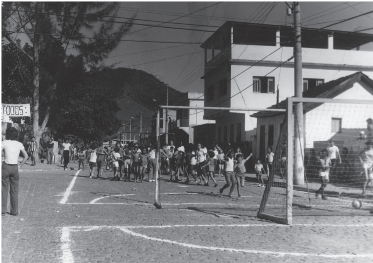
Evento comemorativo Ruas de Lazer. Viana. 1982?.