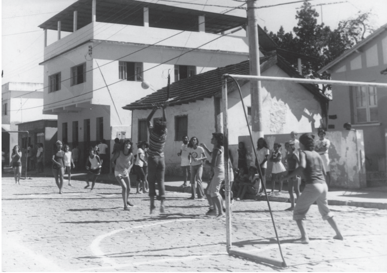
Evento comemorativo Ruas de Lazer. Viana. 1982?.