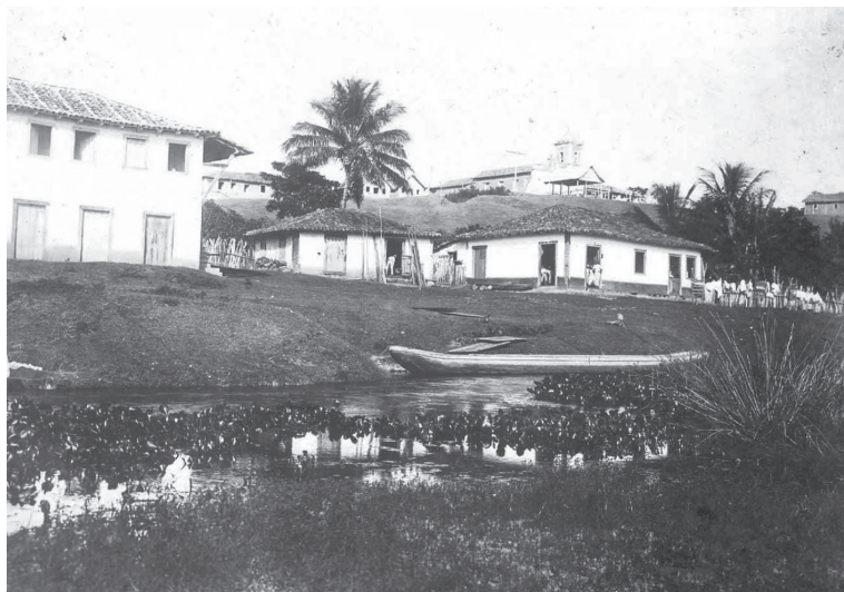
Araçatiba. Viana/ES. 1907/1908.