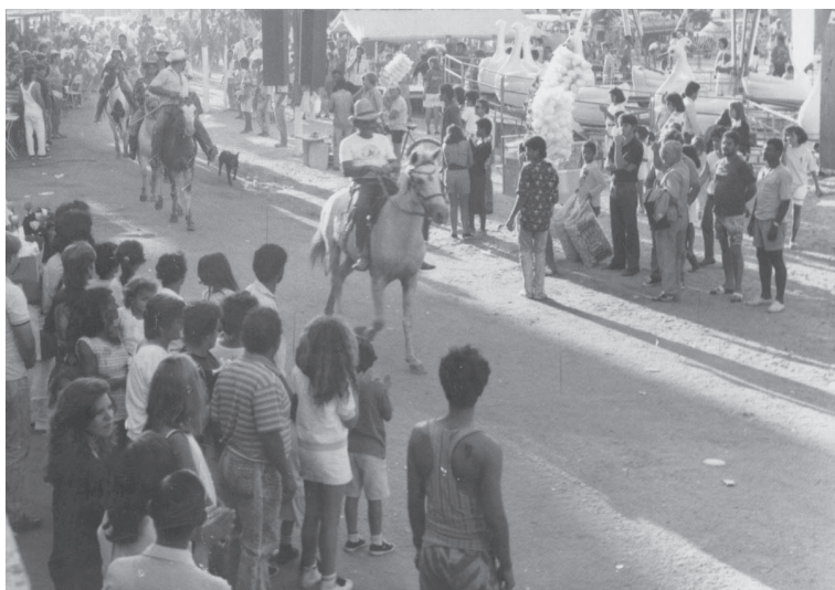
Feira da Educação. Viana/ES. Sem data.