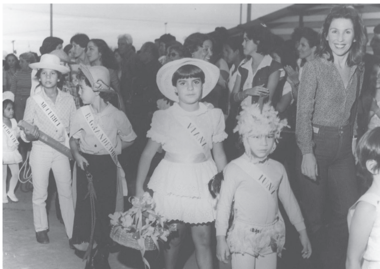
IX Feira Capixaba dos Municípios. Vitória/ES. Década de 1980.