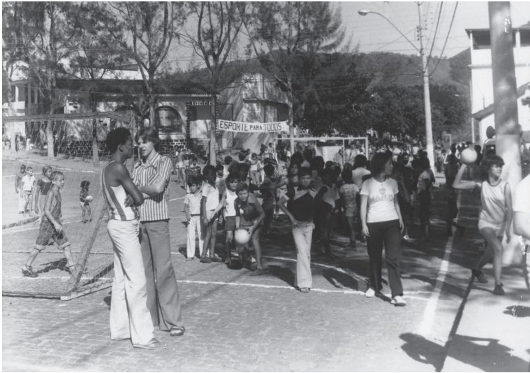
Evento comemorativo Ruas de Lazer. Viana. 1982?.