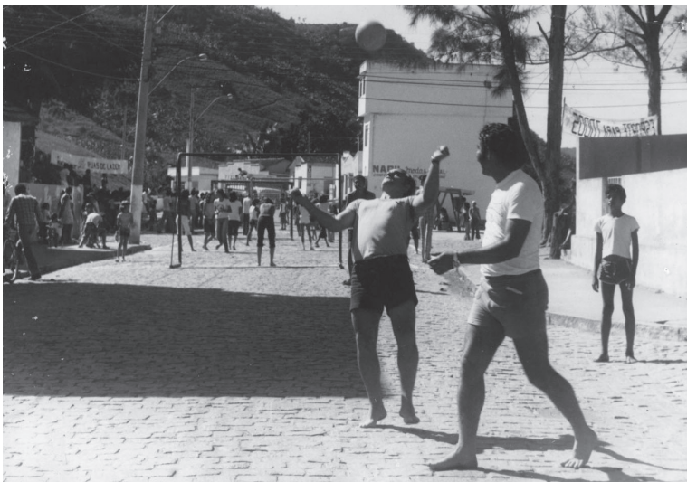
Evento comemorativo Ruas de Lazer. Viana. 1982?.