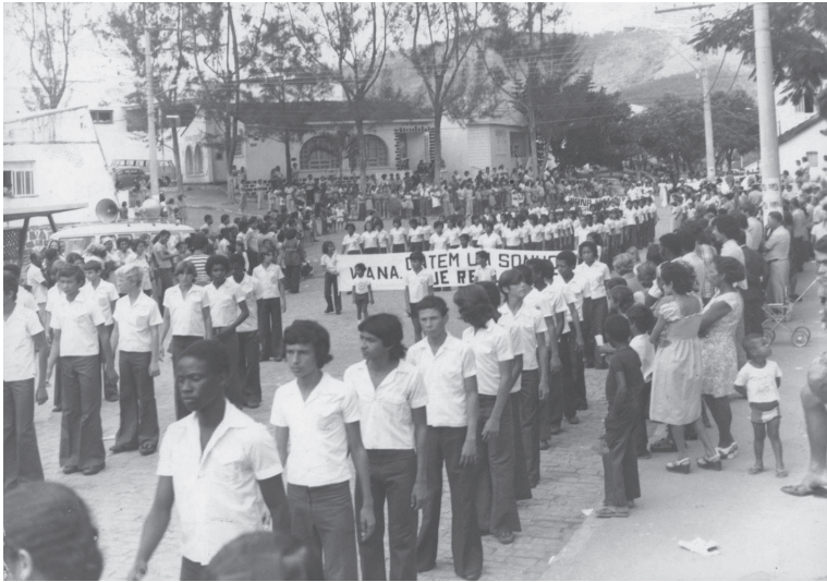
Desfile Cívico Escolar. Viana/ES. Sem data.