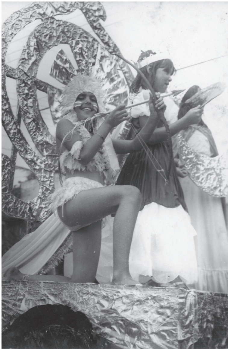
Desfile cívico. Viana/ES. Sem data.