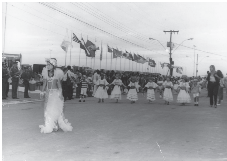
IX Feira dos Municípios. Viana/ES. Década de 1980.