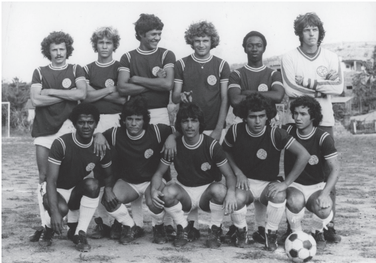
Time da Desportiva Rodoviária. Cariacica/ES. Sem data.