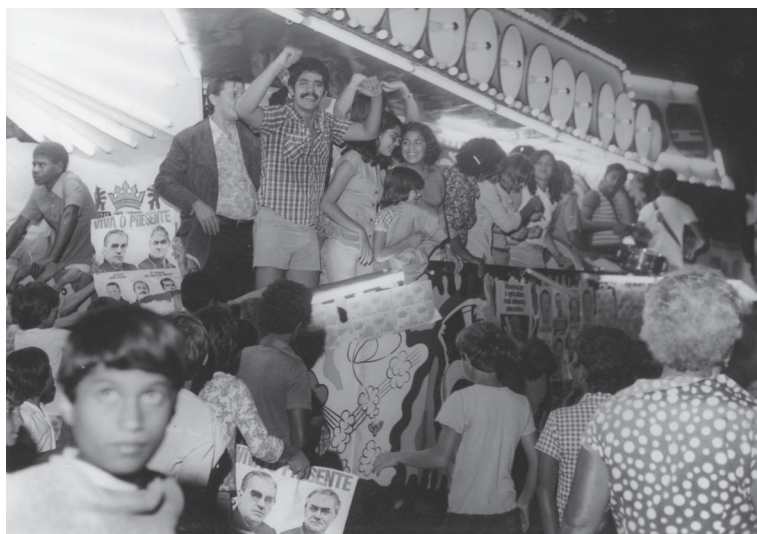
Campanha política. Viana/ES. 1983.