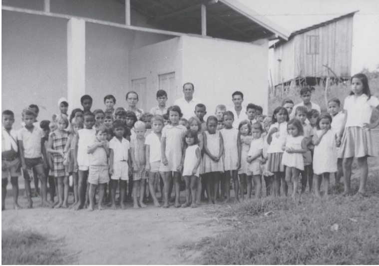
Escola Pública de Ponte Preta. Viana/ES. 1968.