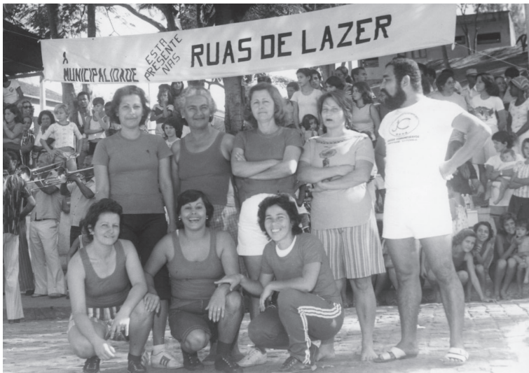
Evento comemorativo Ruas de Lazer. Viana. 1982?.