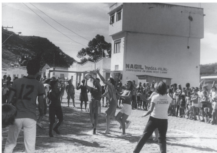
Evento comemorativo Ruas de Lazer. Viana. 1982?.