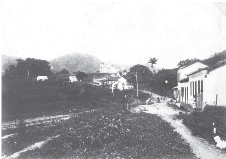
Parte da Vila de Viana. Viana/ES. 1907/1908.