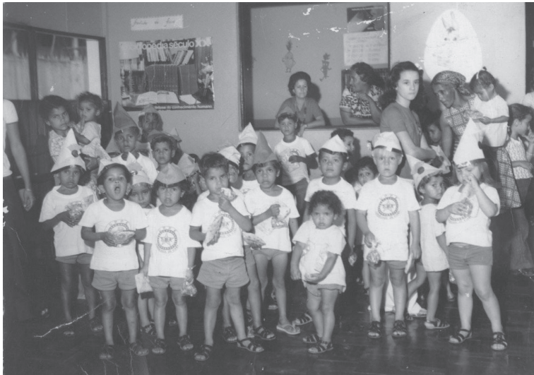
Atividade escolar. Viana/ES. Sem data.