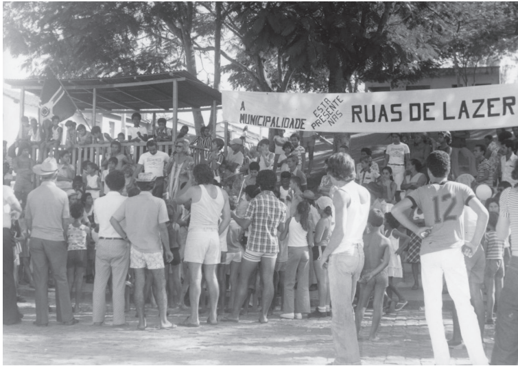
Evento comemorativo Ruas de Lazer. Viana. 1982?.