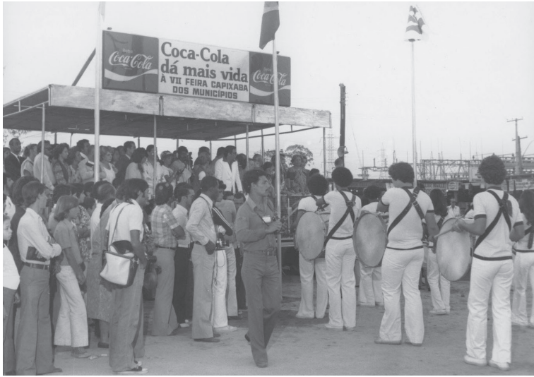
VII Feira Capixaba dos Municípios. Vitória/ES. Década de 1970.