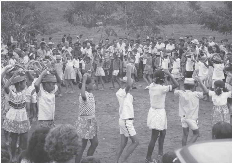
Festa Junina. Viana/ES. Sem data.