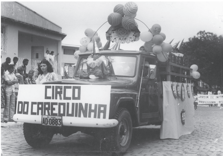
Desfile Cívico Escolar. Viana/ES. Sem data.