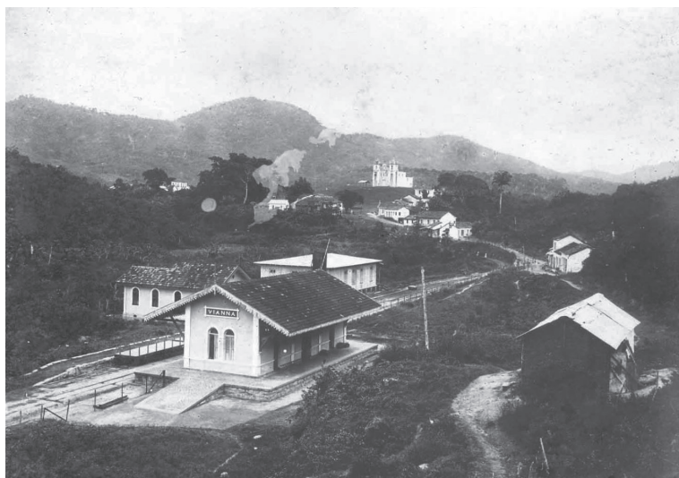
Vista da Vila de Viana. Viana/ES. 1907/1908.