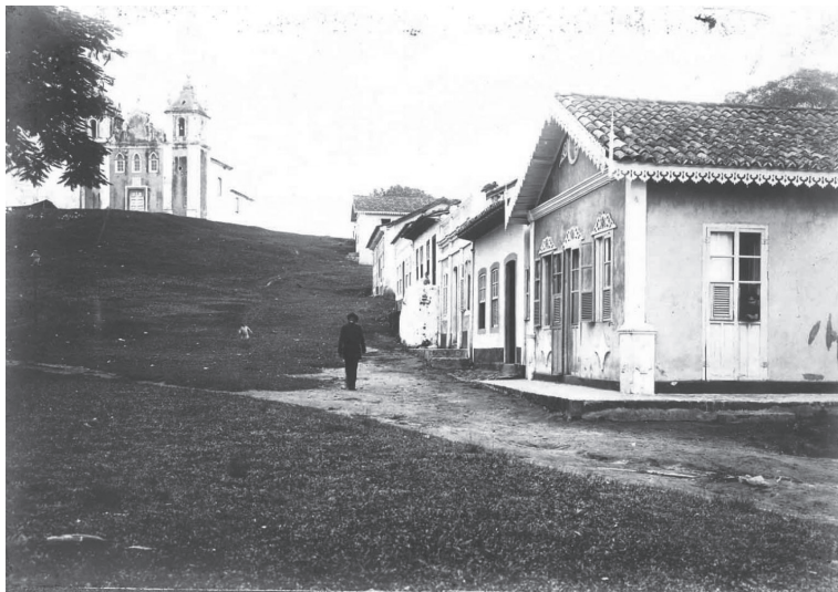
Praça da Matriz. Viana/ES. 1907/1908.