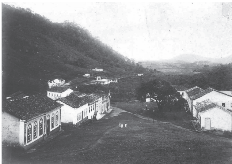
Vista do alto da Matriz. Viana/ES. 1907/1908.