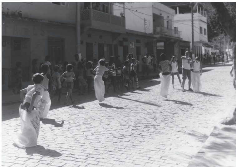
Evento comemorativo Ruas de Lazer. Viana. 1982?.