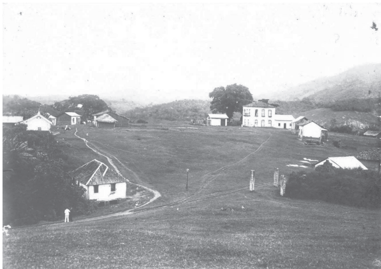
Praça de Viana. Viana/ES. 1907/1908.